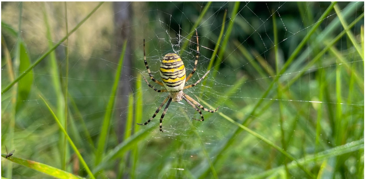
Vrouwtje van de tijger- of wesp spin ( Argiope bruennichii ).