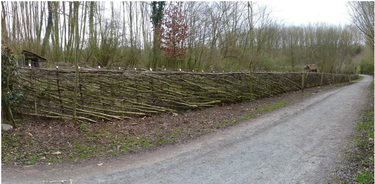
Door Arnaud Florenne gevlochten heg nabij Brussel.