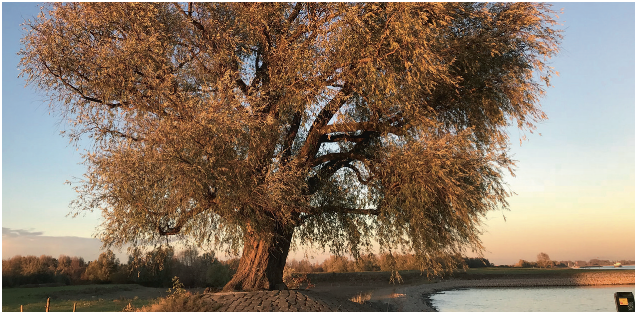
De monumentale schietwilg ( Salix alba ) langs de Waal bij Varik.