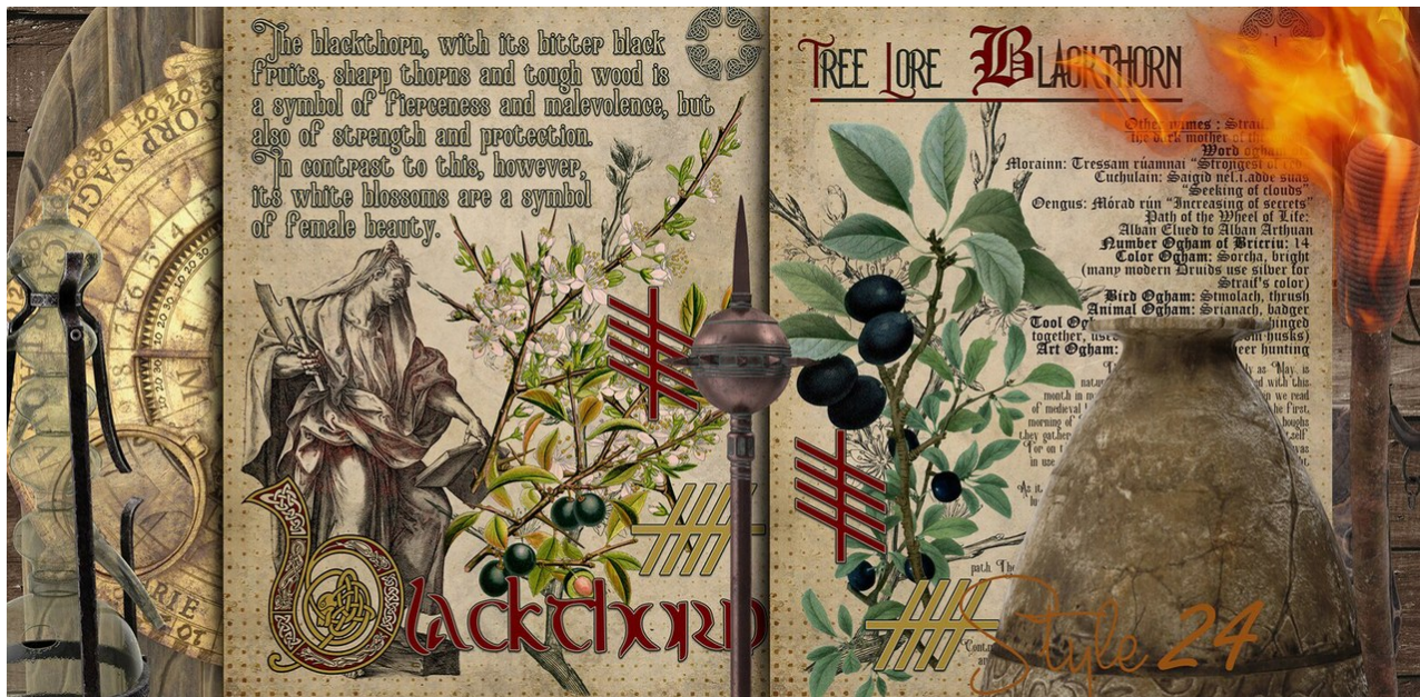
Sleedoorn (Blackthorn) uit de Druid Calendar .